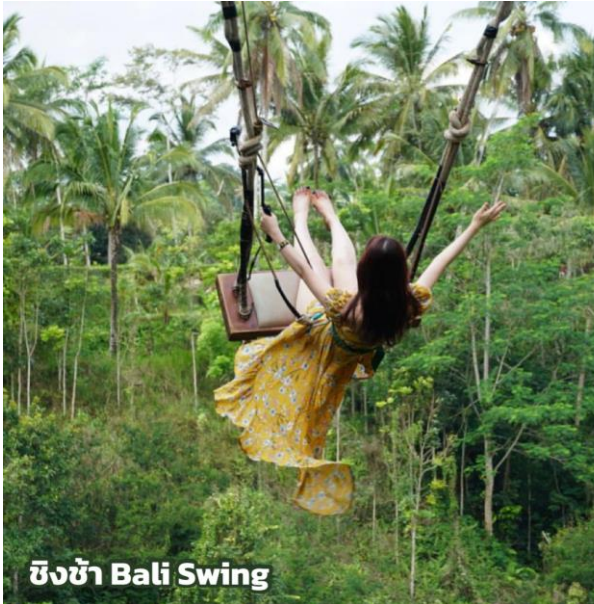
ชิงช้า Bali Swing